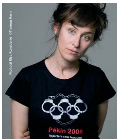
Pipilotti Rist, Künstlerin

Ruth Dreifuss , conseillère fédérale entre 1993 et 2002, première présidente de la Confédération et cheffe du Département de l'intérieur où elle a bataillé ferme pour l'assurance maternité et pour contenir le coût de la Santé publique. De tout temps, elle a combattu pour la justice et la dignité humaine. Parmi ses nombreux engagements, notons le Council of Women World Leaders, un réseau international de femmes présidentes et premiers ministres encourageant les actions favorables aux femmes et au développement durable. Ruth Dreifuss a accepté de devenir membre d'honneur de RSF Suisse avec ces mots: "Je suis fière de faire partie d'une organisation qui défend mon droit fondamental à être informée."