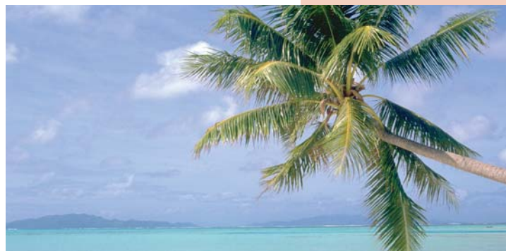
Des paradis trompeurs

Das Internet ist in vielen repressiven Ländern eine wertvolle Möglichkeit, Gleichgesinnte zu finden und politisch zu mobilisieren. Auch der 24-jährige ägyptische Jus-Student